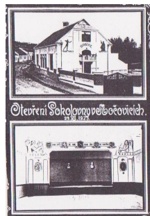
Pohlednice ze slavnostního otevření Sokolovny z roku 1923.

Jak jsem již řekla, k Sokolovně vždy patřilo i mnohoúčelové hřiště. To však (stejně jako celá sokolovna) po léta pustlo. Tomuto neutěšenému stavu udělala přítrž až nedávná rekonstrukce tohoto prostoru. Povrch byl srovnán několika centimetrovou vrstvou škváry a pokryt antukou (pro zajímavost tyto odborné práce prováděla firma „SIBERA“, která v letošním roce vybudovala i antukové hřiště v pražské hale pro českou reprezentaci v boji o semifinále Davis cupu proti Srbsku). Projekt (o celkovém rozpočtu 373.468,-Kč) realizovala firma TES s.r.o. Hřiště je nám všem trvale přístupné. Zastupitelstvo apeluje na to, aby tu zde všichni udržovali pořádek a bezpečnost. Na antuku se smí vstupovat jen ve vhodné obuvi a v žádném případě se po ní nesmí jezdit na kole! M.H.