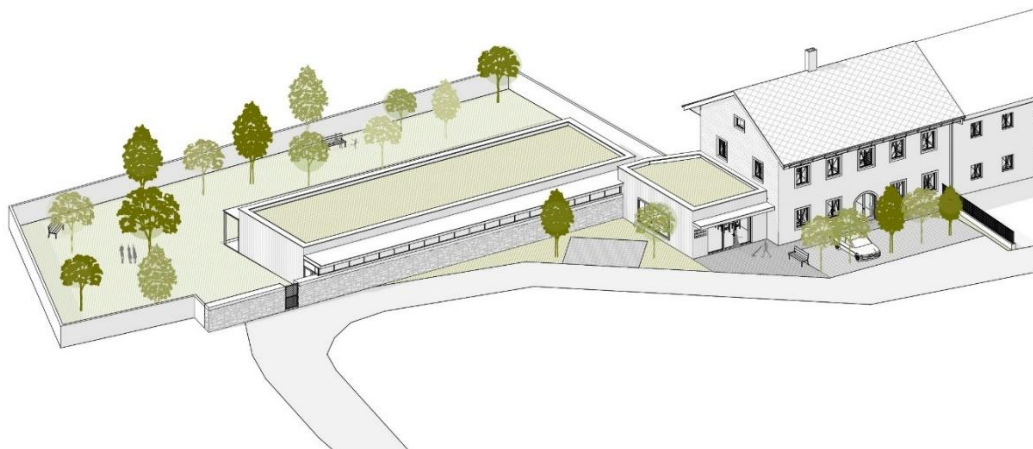
Pohled východní – od nového vstupu (od fabriky):